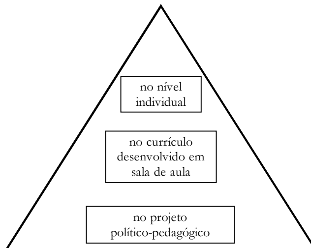
Esquema 2 – Níveis de adaptações curriculares

O texto indica, ainda, que existem três níveis de adaptações curriculares: